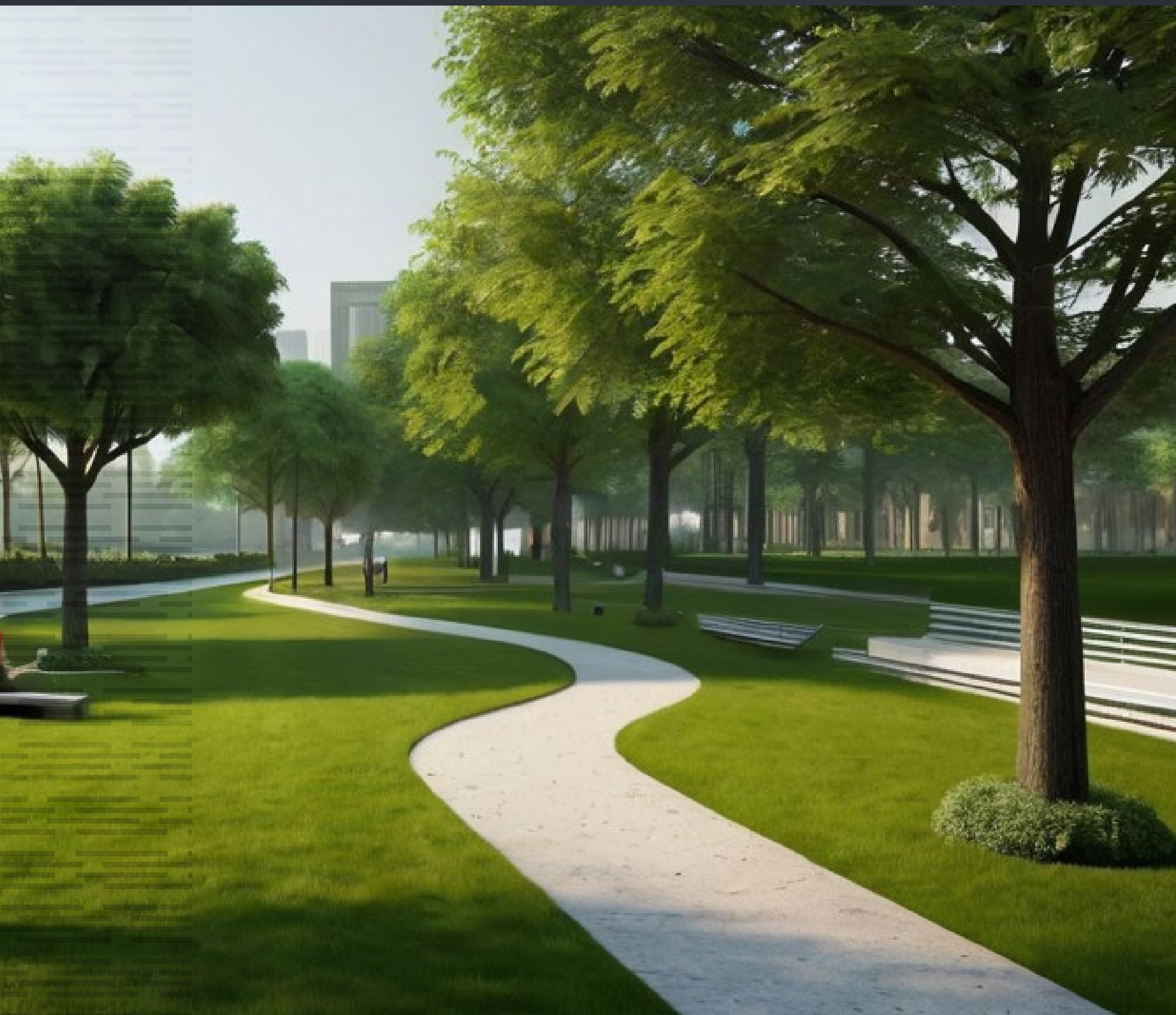
Прогулочный парк около комплекса